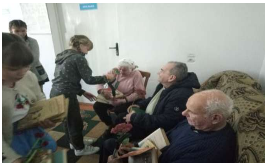
Бібліотерапевтичний захід «Лікуємось книгою»

Бібліотека опікується вихованцями будинку престарілих, здійснює бібліотечне обслуговування, адже у с. Крилів діє «Крилівський центр по обслуговуванню малозабезпечених та престарілих громадян».