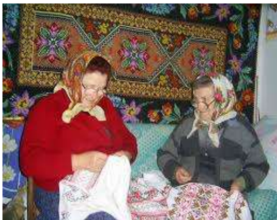
Майстер-клас «Цвіте бабусі вишиванка»

Бібліотека опікується вихованцями будинку престарілих, здійснює бібліотечне обслуговування, адже у с. Крилів діє «Крилівський центр по обслуговуванню малозабезпечених та престарілих громадян».