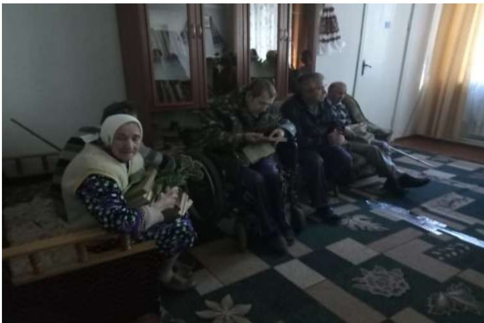
День психолога «Радість, позитив, усмішка – найкращі ліки для довголіття»

Цікаво в бібліотеці проходить День психолога для літніх людей «Радість, позитив, усмішка – найкращі ліки для довголіття», який включає практичні заняття з елементами тренінгу з розвитку позитивних емоцій, релаксаційної музики, під час якої згадуються назви книг, яких можна назвати «смішні», ігри, рефлексії «Світлі пейзажі Крилова» та бібліокафе «Трав'яний чай за бабусиним рецептом».