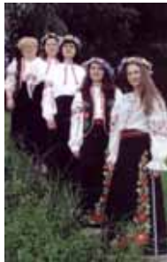
Учасники художньої самодіяльності обласної організації УТОС під час концертних виступів